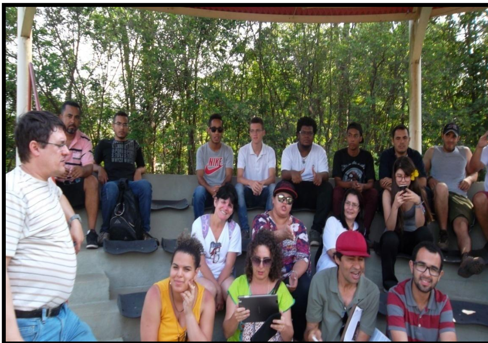
Alunos no Parque da Rocha Moutonnée