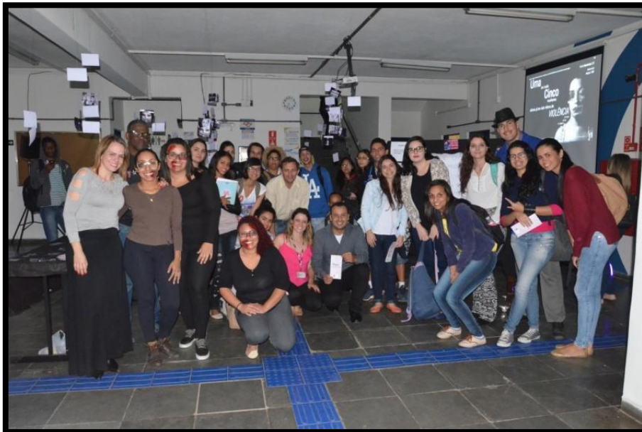
Alunos de Química, docentes e funcionários