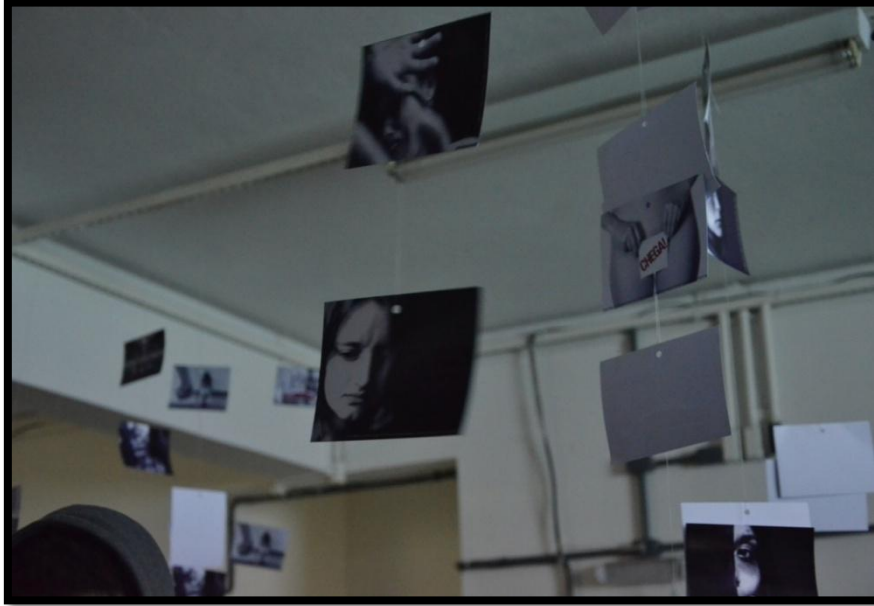
Fotos formavam uma espécie de cortina pela exposição