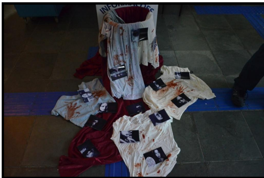
Parte da decoração da exposição