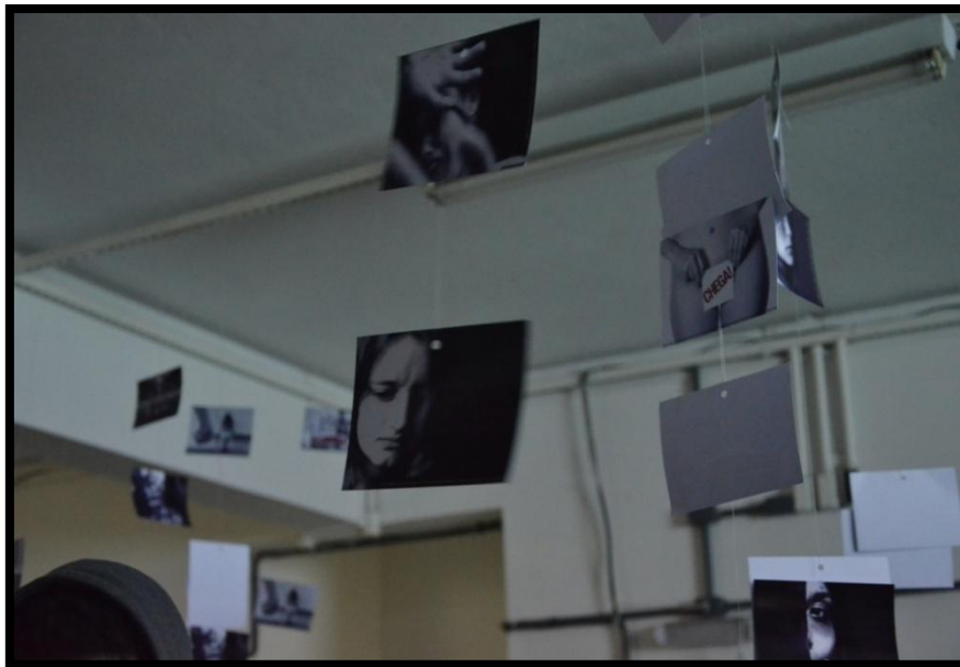
Fotos formavam uma espécie de cortina pela exposição