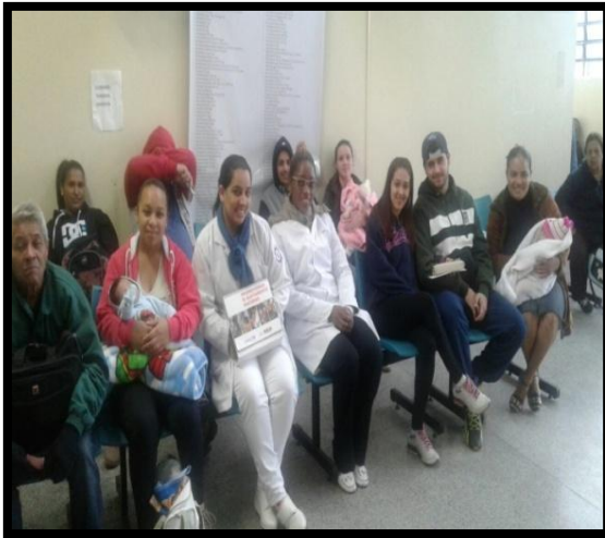
Promovendo o aleitamento materno