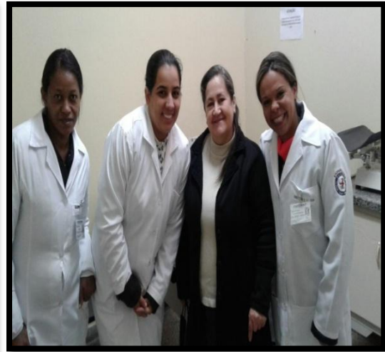
Programa HIPERDIA: Estimulando o autocuidado