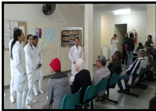
Orientação sobre Hipertensão Arterial