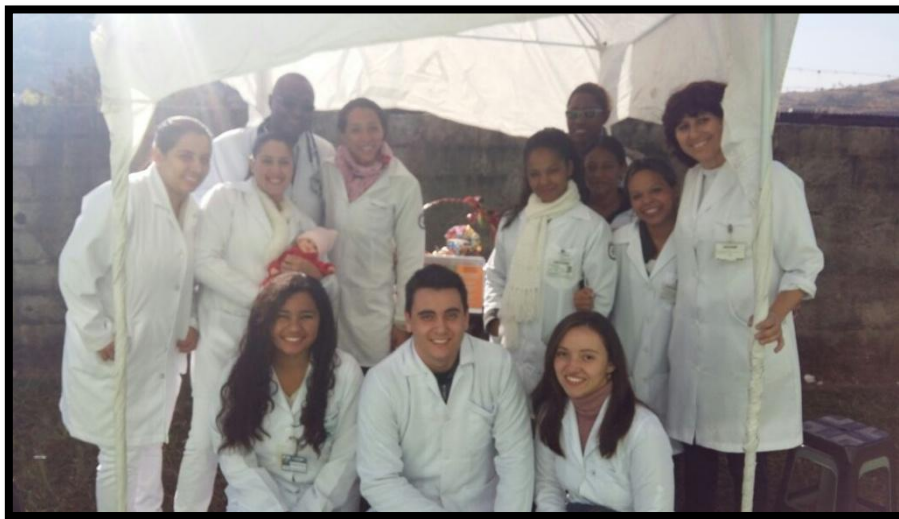
Interação entre as turmas dos 7º e 2º semestres...aprendendo a cuidar...