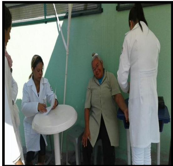
Controle de peso, PA e IMC. Orientações para hipertensos e diabéticos