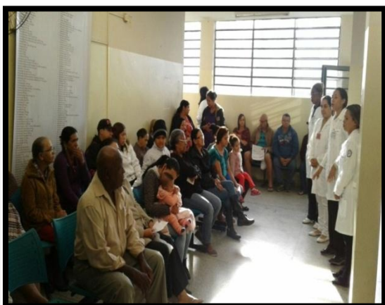
Orientação sobre Diabetes