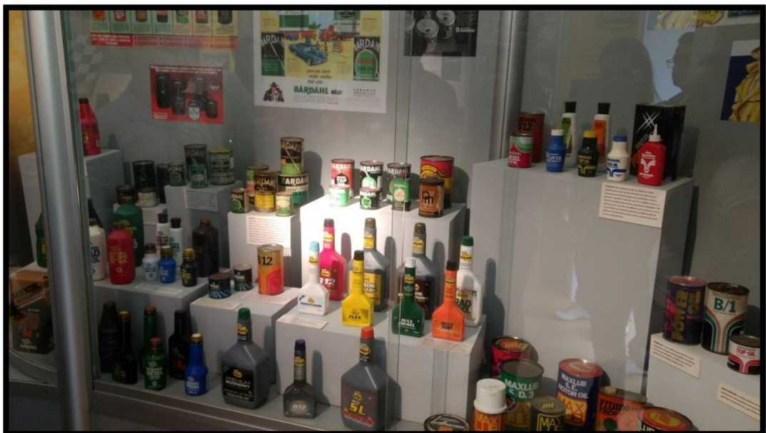
Centro de Memória da empresa Bardahl Promax