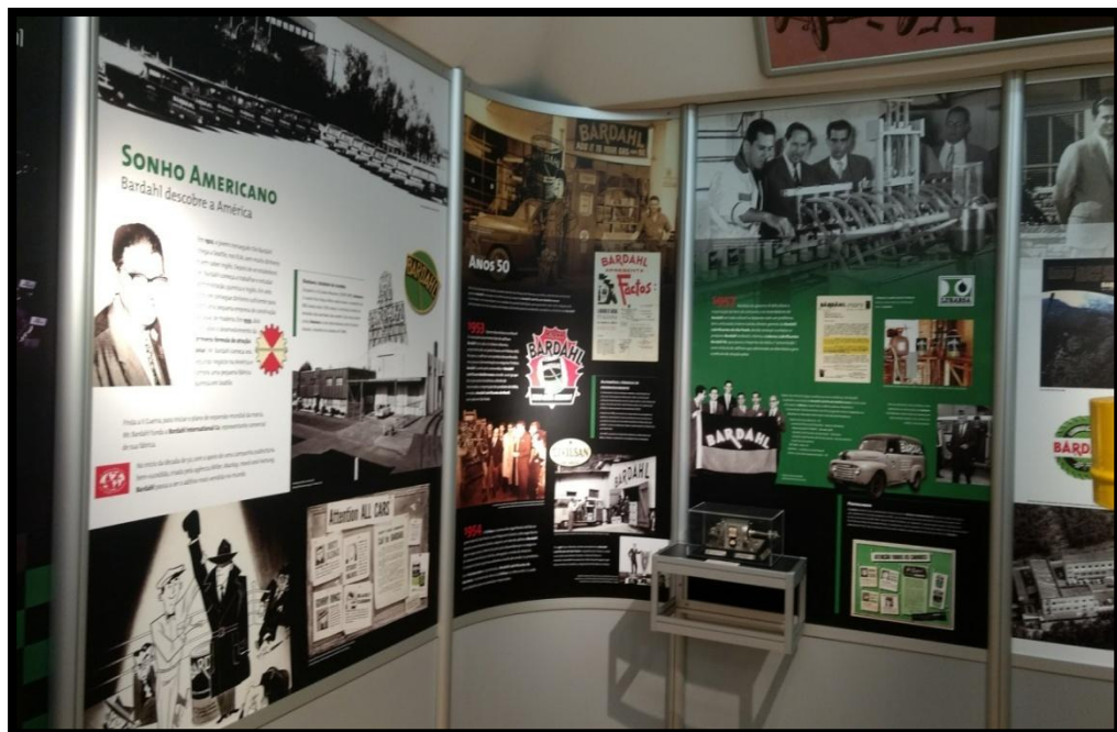
Centro de Memória da empresa Bardahl Promax