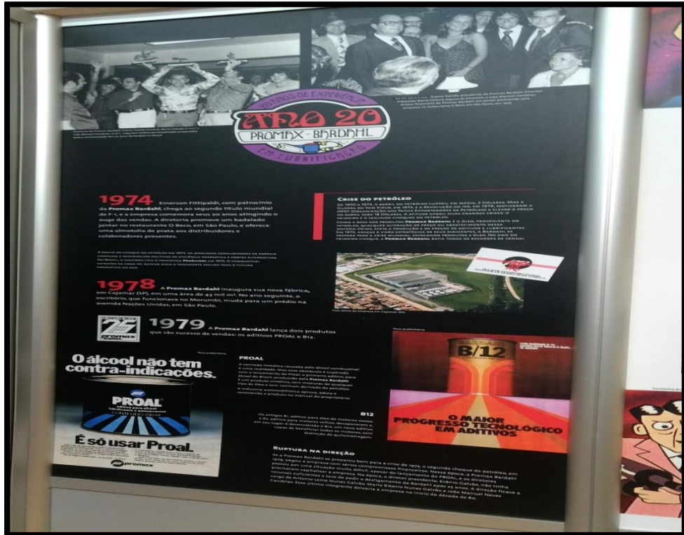
Centro de Memória da empresa Bardahl Promax