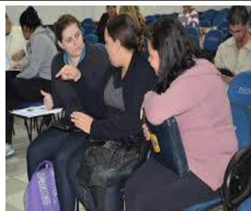
Alunos de Geografia e História que participaram da palestra.