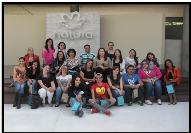
Figura 4 e 5 - Discentes na empresa, durante a visita; e, ao fim, com os brindes recebidos.