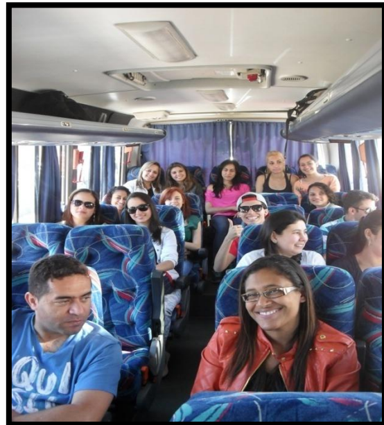
Fig. 1 e 2 – Alunos em frente à IES e no ônibus para a visita técnica.