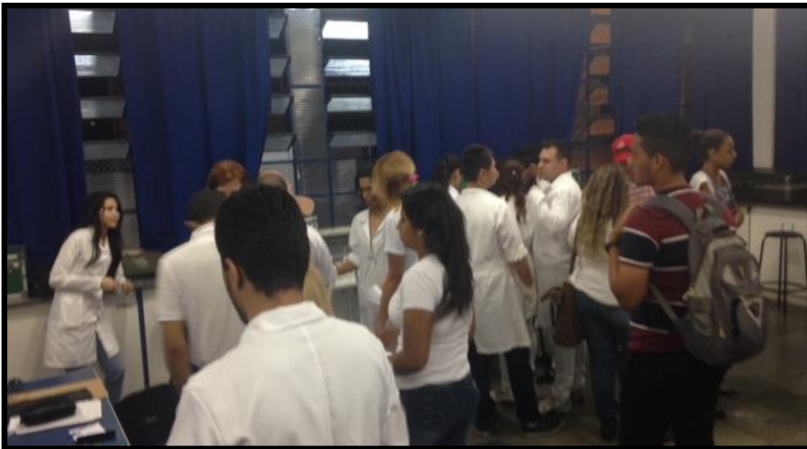
Foto: Avaliação do risco cardiovascular.