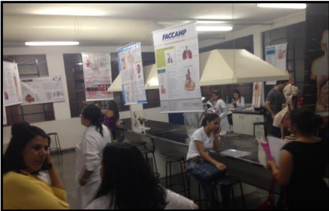
Foto: Atividade de órgãos e sistemas do corpo humano.