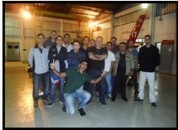
Visita ao HANGAR