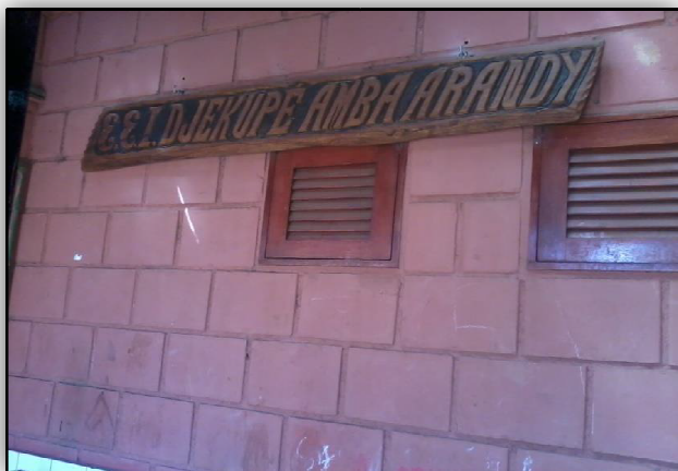
Fachada da Escola