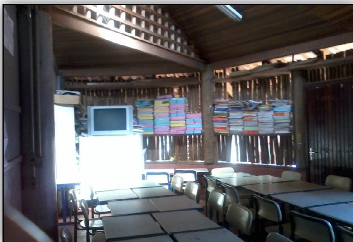
Casa de Reza

Também receberam informações sobre alguns aspectos da cultura indígena Guarani, tais como: batismo, casamento, luto e o uso da Língua Indígena e a convivência com a nossa cultura.