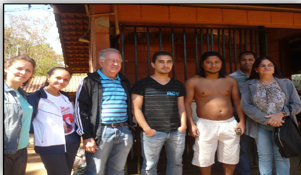
Alunos e Índios

técnica à Aldeia Guarani do Jaraguá em São Paulo. Com especialidade, visitaram a Escola Estadual Indígena Djekupé Amba Arandy, localizada no bairro Jaraguá na capital paulista, mantida pela Secretaria da Educação do Estado de São Paulo, jurisdicionada a Diretoria de Ensino Norte – 1.