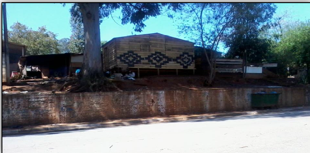
Moradias da Tribo Guarani - Foto: Gerson Alves da Silva

Os alunos foram recebidos pelos indígenas, um deles professor da E.E. Indígena Djekupé Amba Arandy, que oportunamente, em visita monitorada, apresentou a escola, as salas de aula e o espaço físico da aldeia.