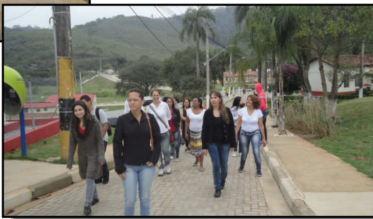
Alunos do curso técnico de enfermagem.