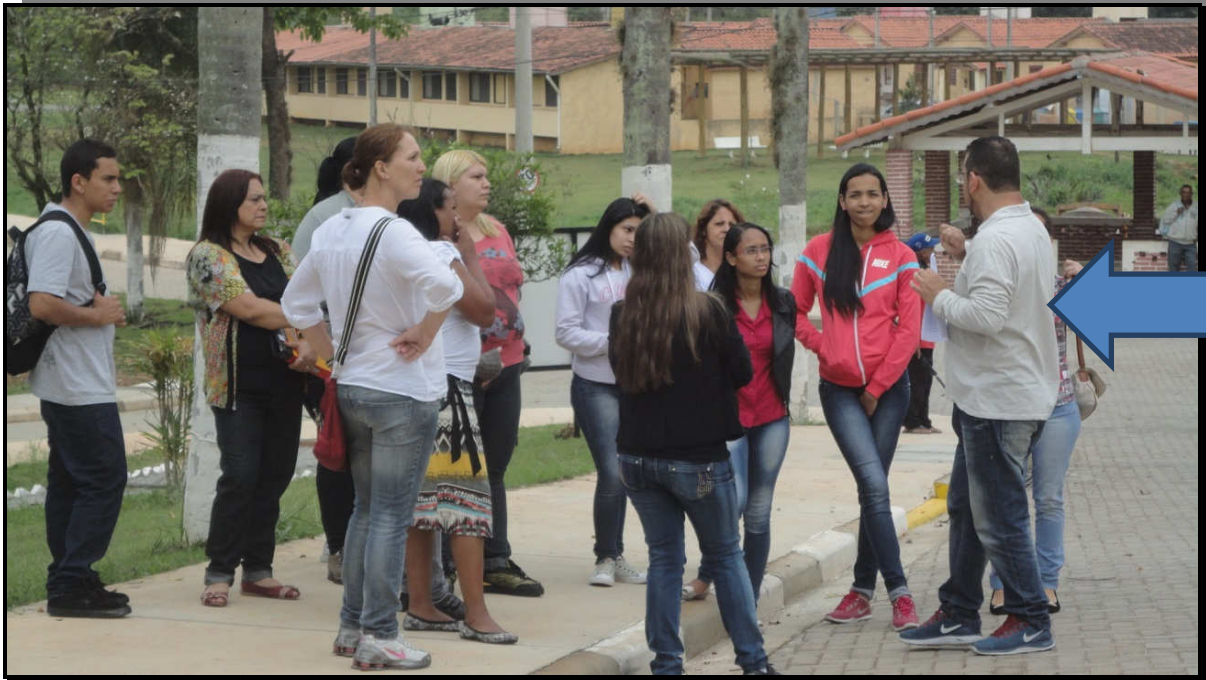
O enfermeiro explicando para os alunos sobre o local.