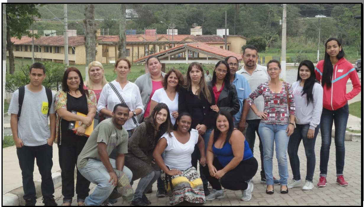
Alunos, o enfermeiro da instituição e um dos moradores de lá (paciente).