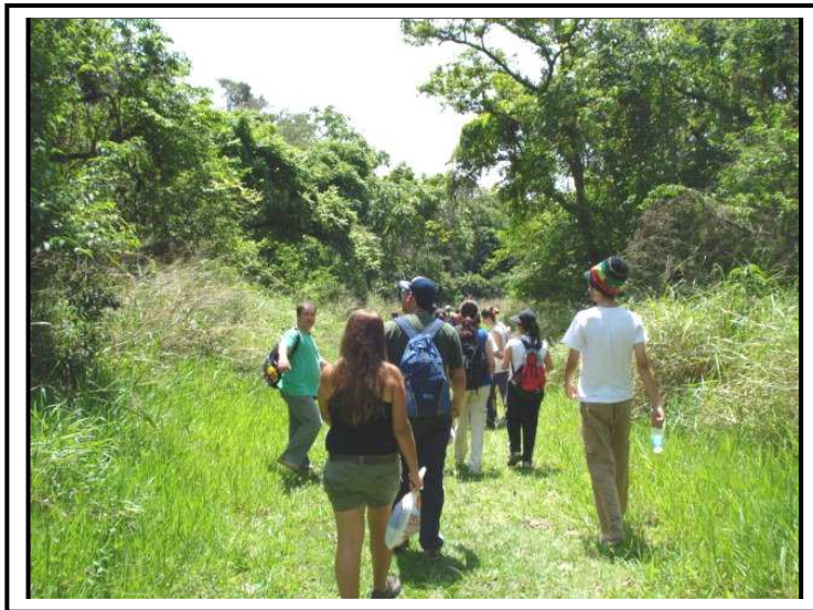
Foto VII- Grupo Faccamp em trilha de reconhecimento a flora local