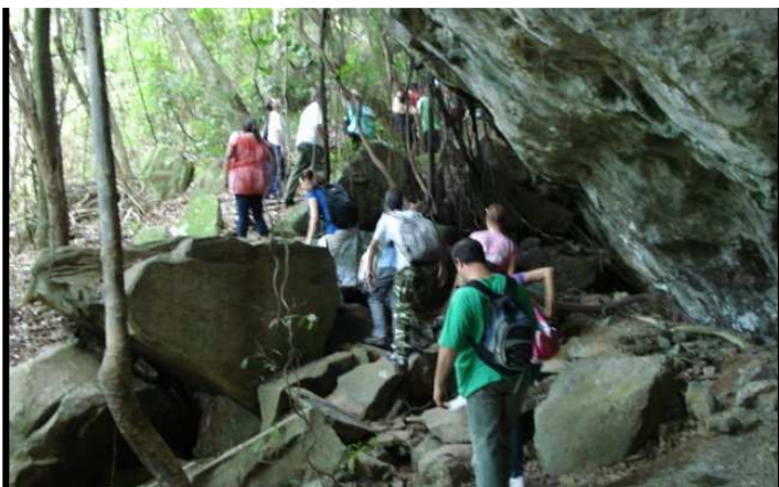
Foto III – Trilha para sítio histórico, margeando a formação geológica local.