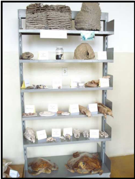
Foto I - Imagem do acervo da fauna local