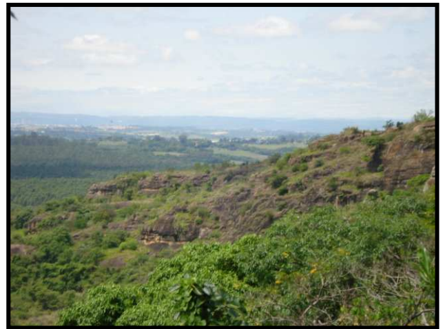
Foto VI – vista Geral do alto da Trilha Pedra Santa – Sorocaba ao fundo.