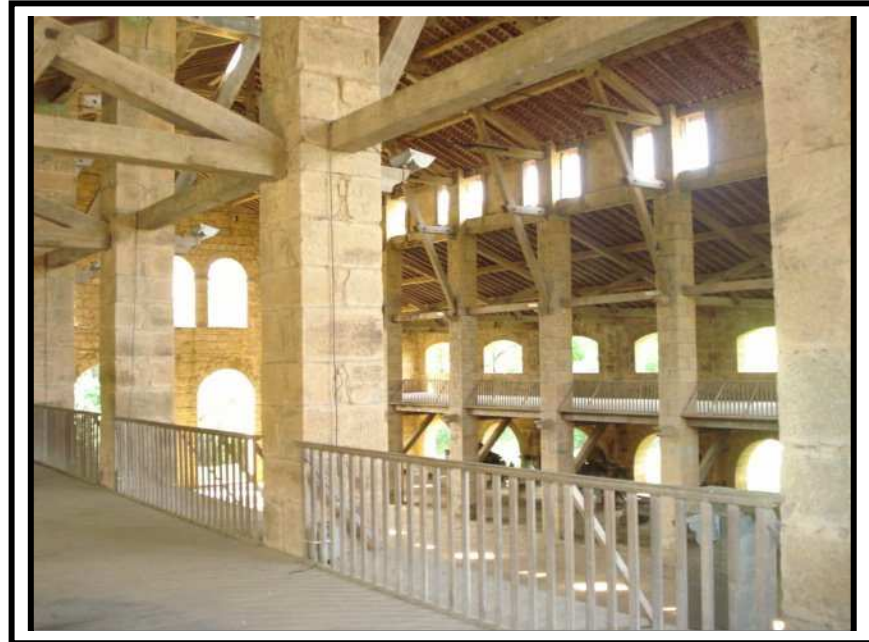
Foto II - Prédio histórico da Real Fábrica de Ferro