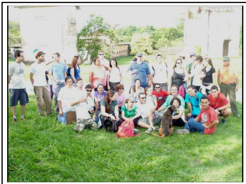
Foto VIII – Grupo de discentes e docentes da FACCAMP e conjunto do patrimônio arquitetônico histórico ao fundo