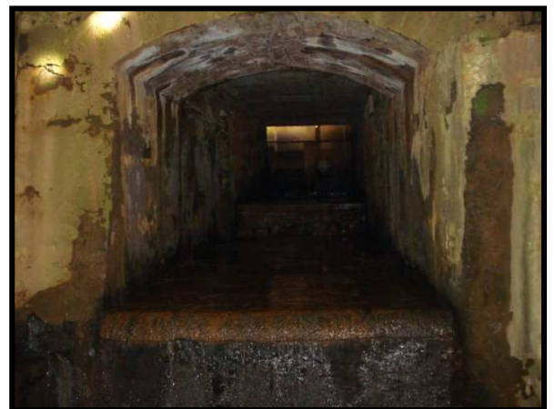
Foto IV – Interior de prédio do conjunto arquitetônico da Real fábrica de Ferro (patrimônio histórico)