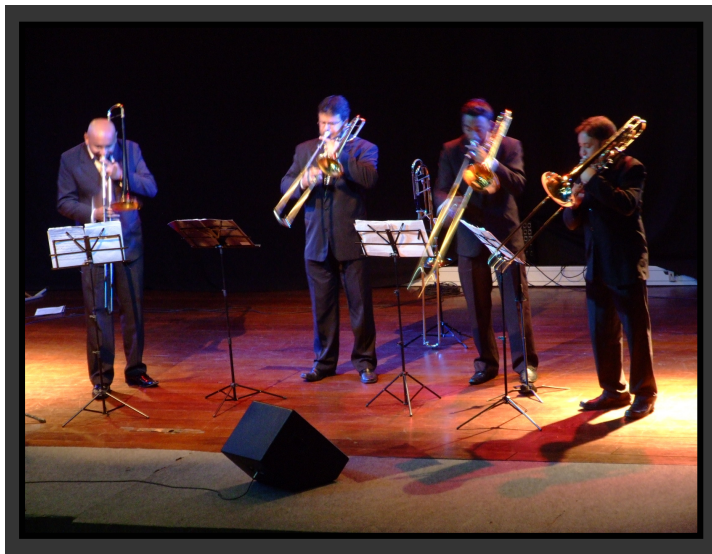
Quarteto de Trombones

A formação de qualidade proposta pela missão institucional foi vivenciada em cada dia. Para melhor compreensão do evento, veja a programação da semana: