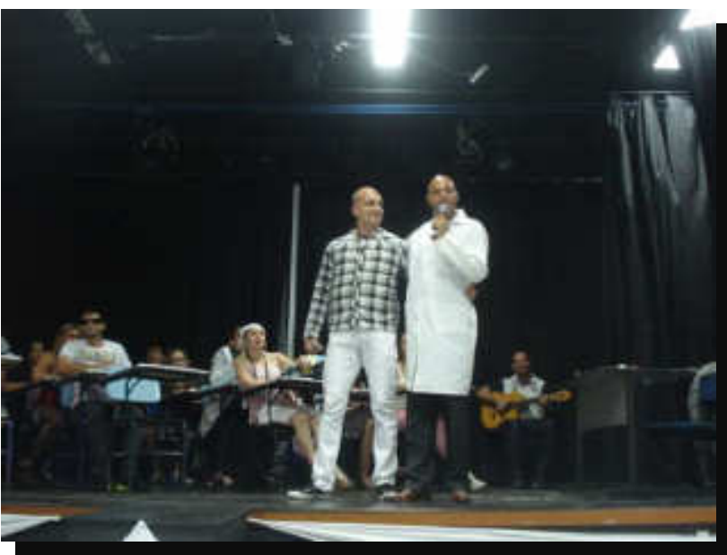
Acontece Faccamp – ano 2012