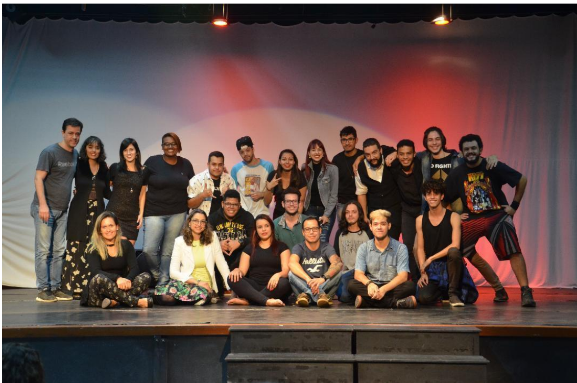
Evento mostrou os muitos talentos da Instituição, numa noite de cultura e emoção, em sua quarta edição

O evento é organizado pelos próprios alunos e ajuda a desenvolverem seus talentos; este ano, além dos discentes de Música, participaram também, os de Educação Física