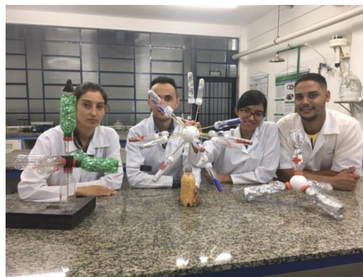
Uma maneira de enxergar na prática a teoria

Estrutura I, Química dos Elementos II e Estrutura da matéria.