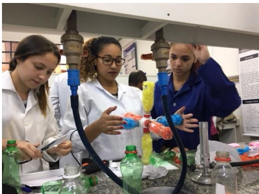
Os alunos se envolveram muito com o projeto

O objetivo do evento foi proporcionar maior entendimento do conceito de orbitais, através da confecção dos orbitais s, p, d, utilizando materiais recicláveis.