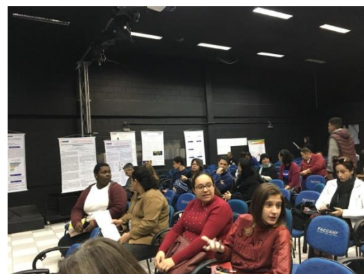
Evento na manhã de sábado recebeu docentes, estudantes e pessoas da comunidade

O evento contou também com pessoas da comunidade que prestigiaram o esforço dos estudantes.