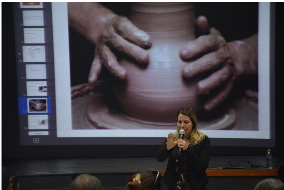
Os projetos de Iniciação Científica abrangem diferentes campos das graduações, de diversas áreas de conhecimento

A iniciação científica é uma atividade de pesquisa acadêmica desenvolvida por alunos de graduação sobre diversas áreas de conhecimento