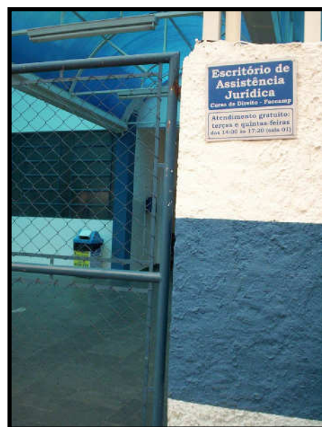
Visão da entrada do Prédio onde está instalado o EAJUR