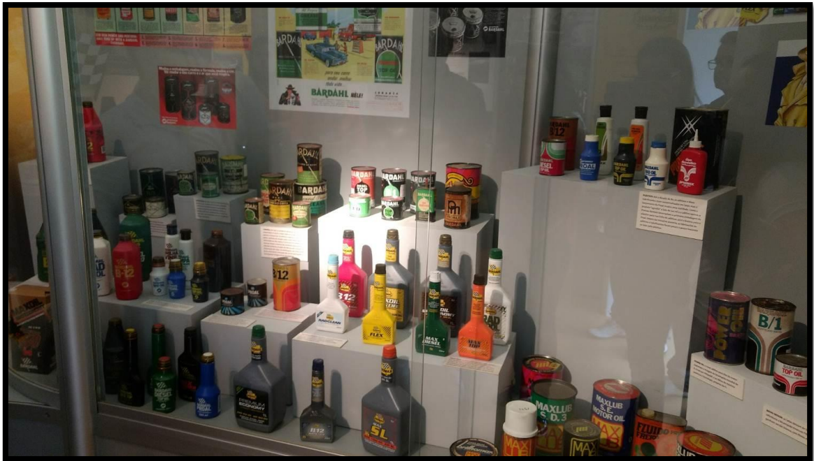
Centro de Memória da empresa Bardahl Promax.