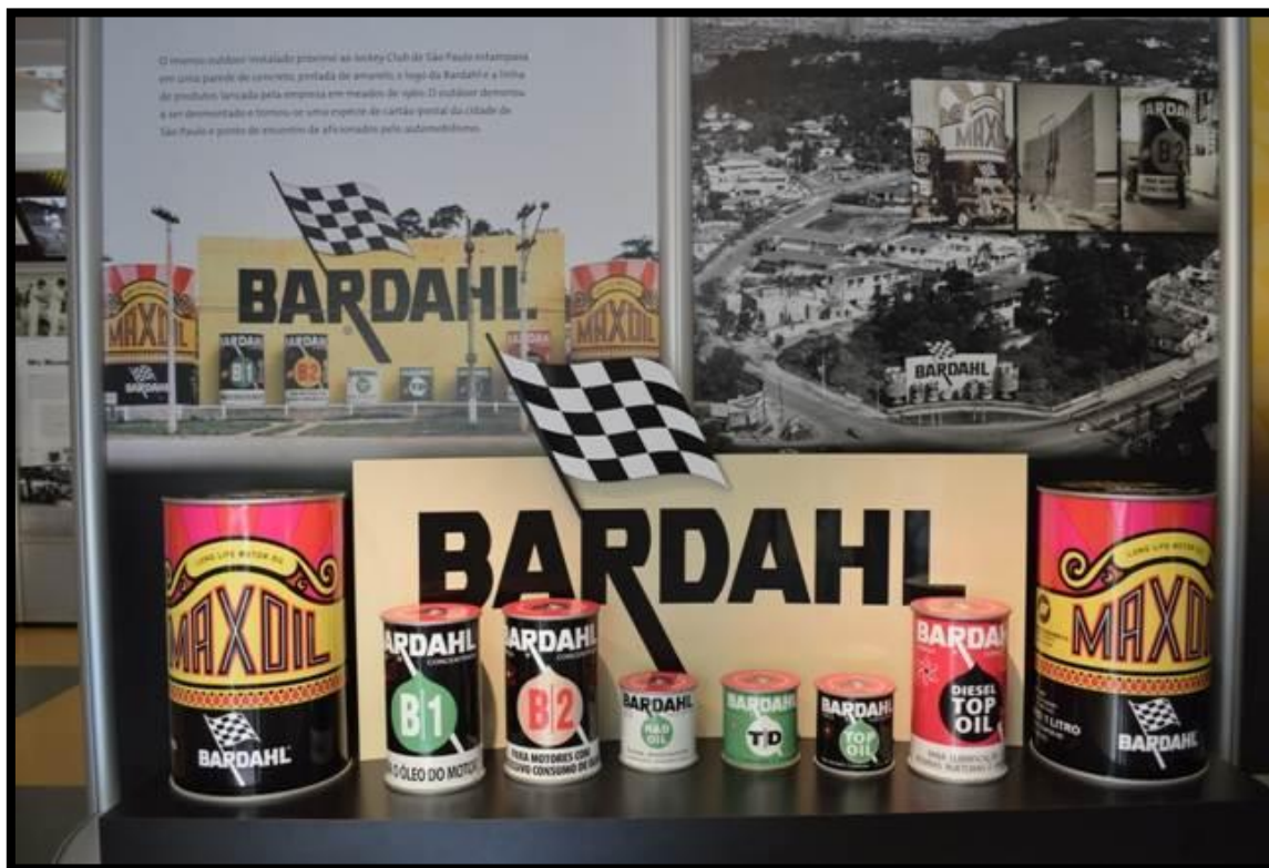
Réplica do outdoor com produtos Bardahl Promax que tinha na entrada do bairro do Morumbi, em São Paulo.