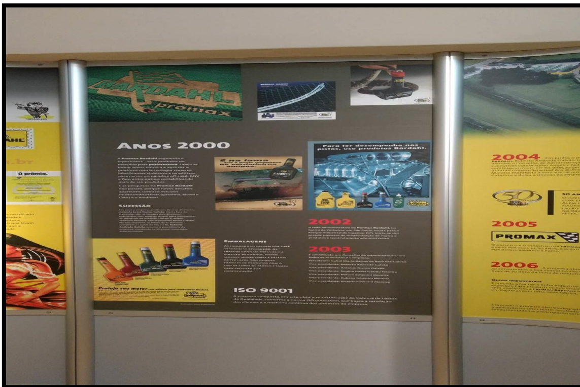
Centro de Memória da empresa Bardahl Promax.