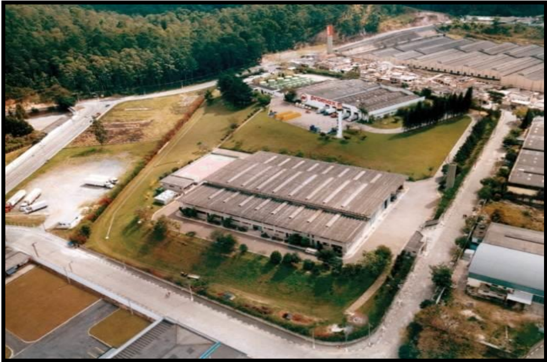
Vista aérea do complexo da Bardahl Promax em Cajamar, interior de São Paulo, onde está desde 1978.