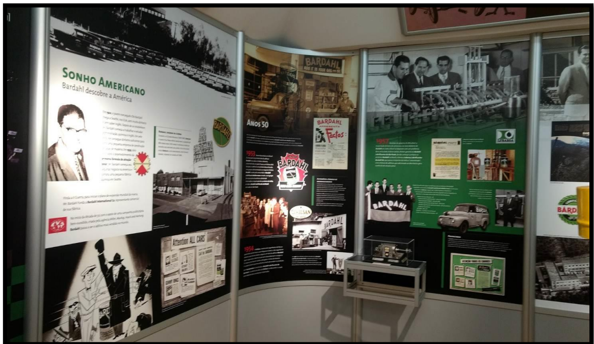
Centro de Memória da empresa Bardahl Promax.