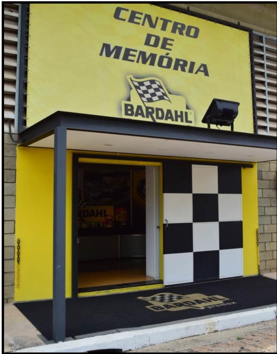
Centro de Memória da empresa Bardahl Promax.