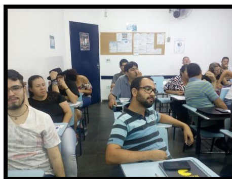
Discentes da Geografia durante a palestra sobre cavernas