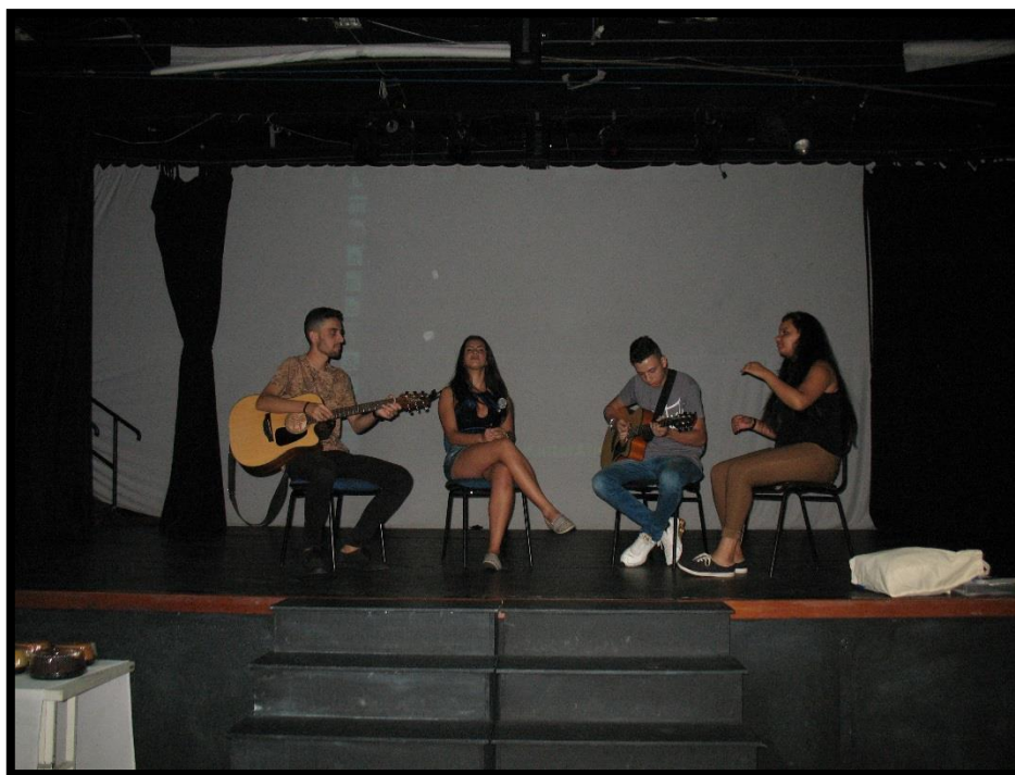
Alunos de Comunicação Social