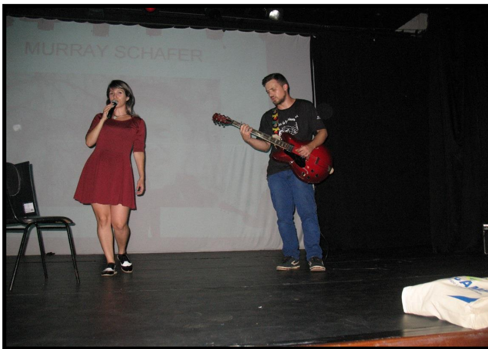
Apresentação musical dos alunos do curso de Música.