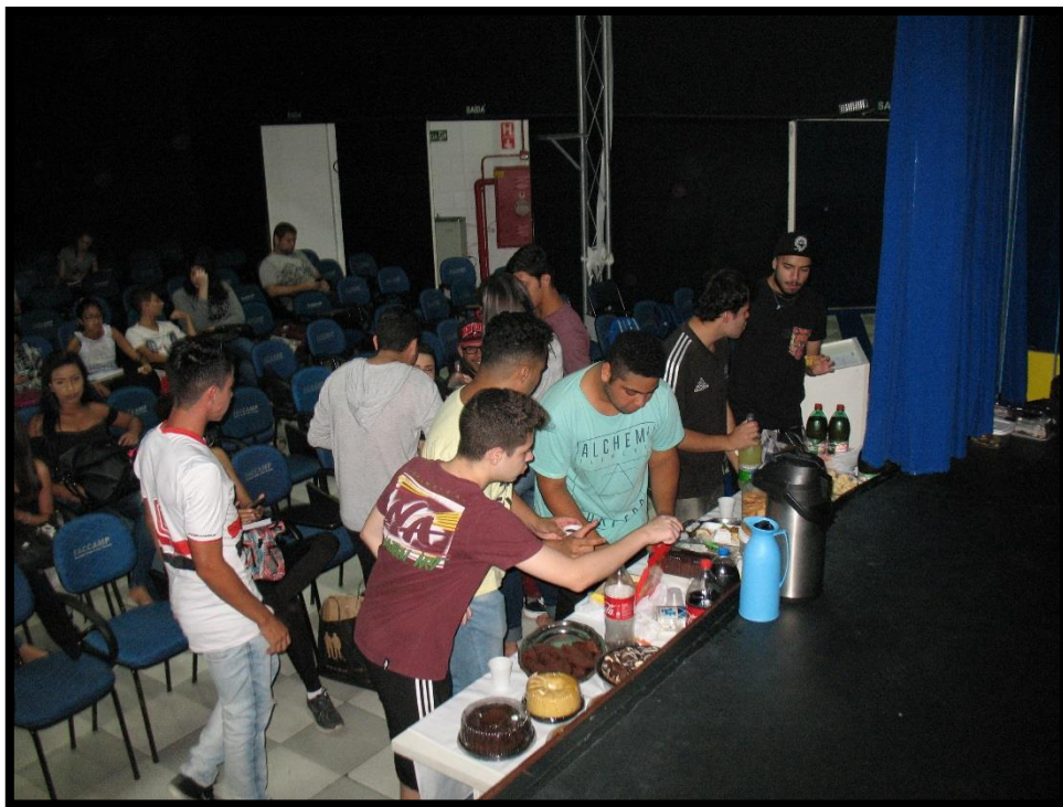
Hora do lanche comunitário