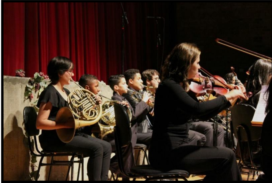
Orquestra Sinfônica do Projeto Guri de Jundiaí