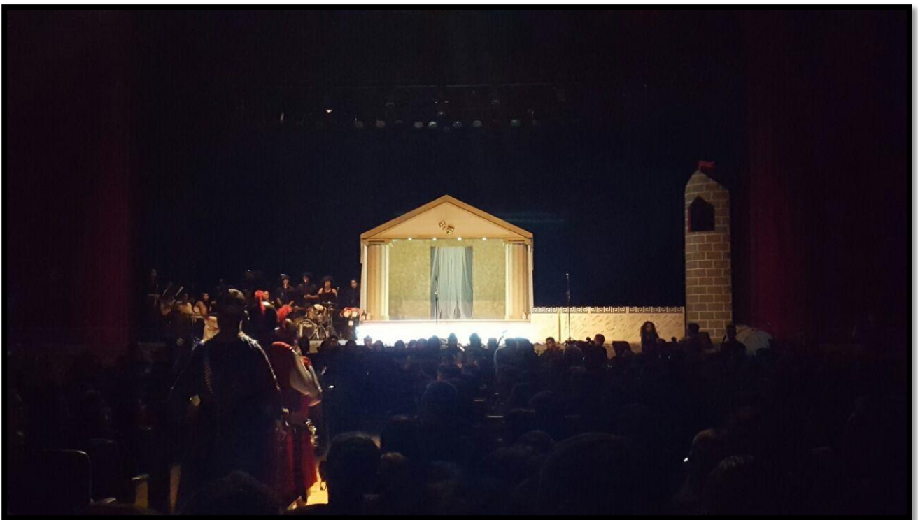
Alunos do curso de Música ao fundo, do lado esquerdo